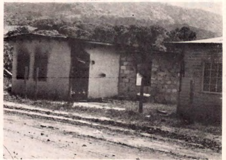
PIEDRA CANDELA, es un lejano poblado en el límite sur con Panamá. Sus pocos habitantes huyeron al verse en peligro, debido a las frecuentes incursiones dentro del territorio nacional que hacían los revolucionarios como la Guardia Civil panameña persiguiéndolos. Nótese en las casas y en la pared los huecos de los disparos.

Anúnciese y suscríbese a "COSTA RICA DE AYER Y HOY"